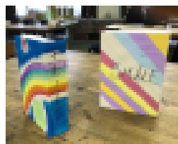
《スパイス仕事・ガラムマサラ作り》