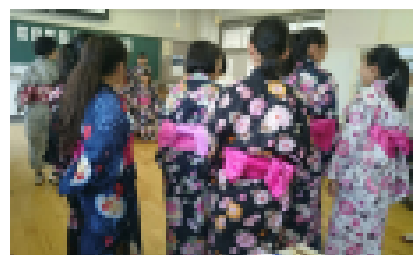
《2年生全員で浴衣体験》