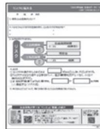
≪ 生徒用ワークシート ≫