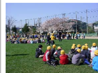
4月 芝生の上の始業式