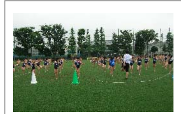
7月 プールの準備運動