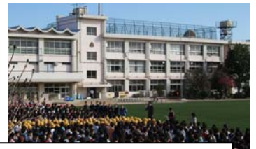
芝生開き 平成18年3月13日