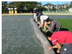
11月 児童集会のために養生シートをはずす