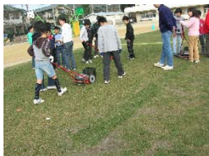
1月 6年生が5年生に管理の方法を教える

中村小学校では、平成18年度の研究主題を「芝生で楽しく、芝生となかよく」と設定し、芝生校庭に合わせた授業をどのように教科で進めるか、メンテナンスの活動の仕方等について、研究を進めました。