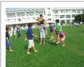
10月 運動会の養生の後、1ヶ月ぶりの裸足デー