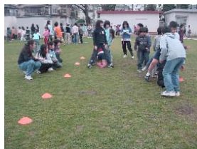
12月 芝生の上の遊びが広がる