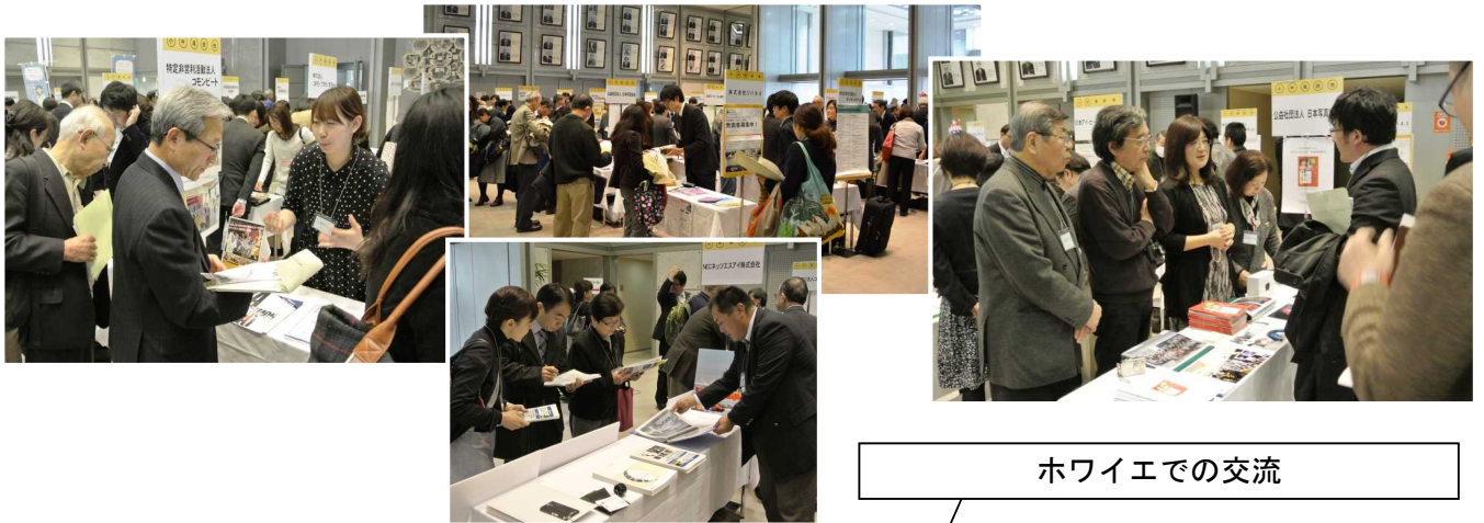
ホワイエでの交流