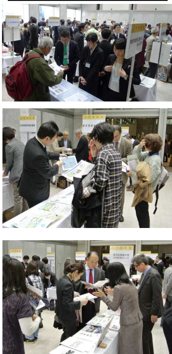
レセプションホールでの交流