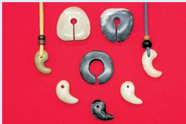
縄文アクセサリー作り教室作品