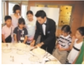
小学生のためのハローワーク～ホテル編

子どもたちが将来の夢について考えるときに、仕事の体験があることはきっと大きな財産となるはず。小学生のためのハローワークでは、「京王プラザホテル」での仕事の実体験を通して、仕事の楽しさや厳しさを学び、豊かな職業観を身に付けます。