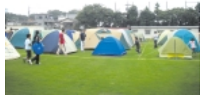
校庭の芝生を活用した夏休みキャンプ 練馬区立中村小学校

東京都生涯学習ホームページを活用して会員団体の活動等について情報を提供したり、会員間の情報交換を推進しています。