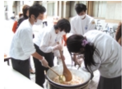
教科「奉仕」の授業 都立第一商業高等学校