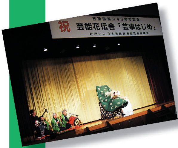
寿獅子舞(芸能花伝会「芸事はじめ」のオープニング)