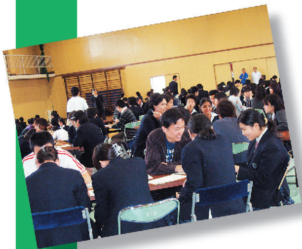
友だちと話している感じ(都立足立東高等学校「カタリ場」相談コーナー)