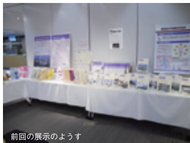
前回の展示のようす

都立多摩図書館では、「東京マガジンバンク」として、幅広い雑誌を収集・提供しており、国内公立図書館の中でも最大級のタイトル数を誇ります。今回の展示では、都立多摩図書館所蔵の雑誌資料とともに、明治以降の主な創刊誌の年表や、雑誌に関わる方たちからのメッセージを御紹介します。出版部数の変化やデジタル雑誌の登場など、雑誌を取り巻く環境が大きく変わりつつある今、雑誌というメディアがどこに向かっていくのかを一緒に考えていきましょう。