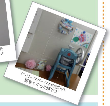
「フリースペースわかば」の 扉をくぐった所です