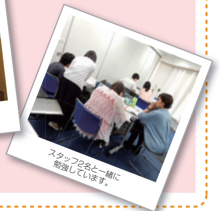
スタッフ2名と一緒に 勉強しています。