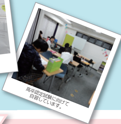
高卒認定試験に向けて 自習しています。