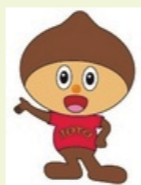
城東職業能力開発センター イメージキャラクター 「ものづくりくん」

新たなセンターでは、高校中退者等に対応した短期訓練や、介護・福祉関連業界での就職に役立つ実技重視の訓練などの新規科目を含め、13科目に訓練規模を拡大し公共職業訓練を実施しています。