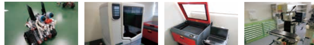
Legoマインドストームによる電子制御 3Dプリンタによる試作品の出力 レーザー加工機 汎用機による加工

入校後一か月をかけて最新の機器を利用しながら、ものづくりへの興味づけ訓練を行います。