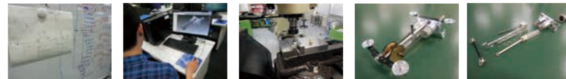
企画 設計 製造 組立 調整

企画、設計、試作、組立、調整に関わる訓練を行います。(写真はスターリングエンジンのデザインから作成まで)