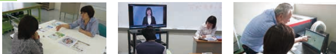
カウンセリング 社会人マナー パソコン基礎