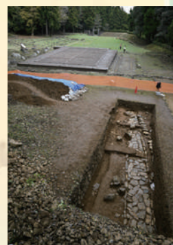
八王子市 国指定史跡・八王子城跡 御主殿と調査区全景