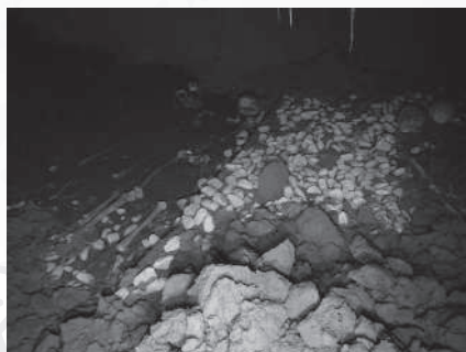
大田区 馬込貝塚内横穴墓 内部状況写真