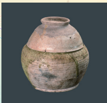
世田谷区 釣鐘池北遺跡 灰釉陶器骨蔵器