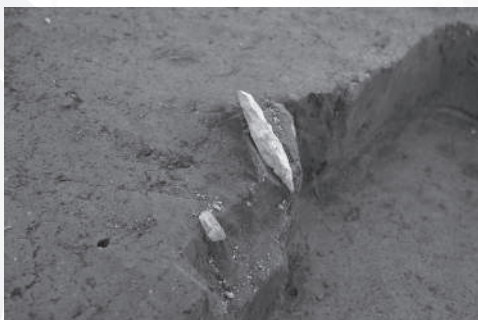
世田谷区 大蔵遺跡 水晶製石器・角錐状石器出土状況