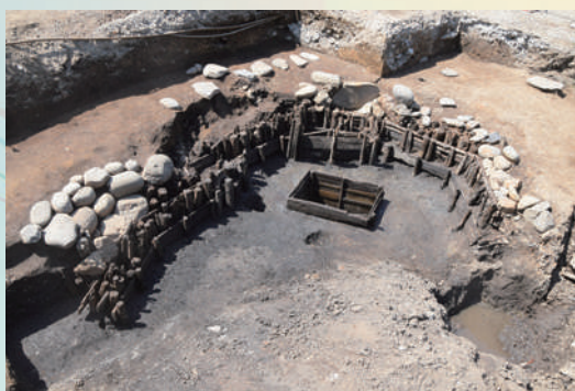
港区 我善坊谷遺跡 護岸をもつ池跡(組屋敷跡)